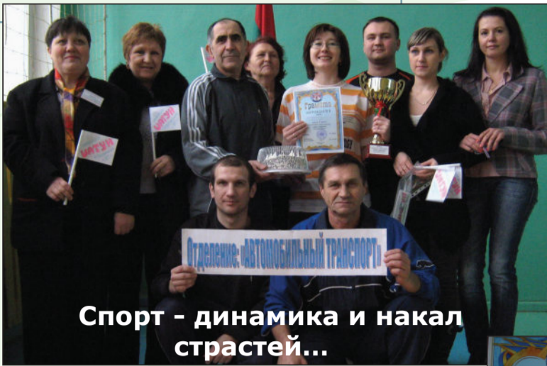
Спорт - динамика и накал страстей...

День здоровья для сотрудников Бендерского политехнического филиала начался под звуки торжественного марша и представления команд, что подняло боевой дух соревнующихся.